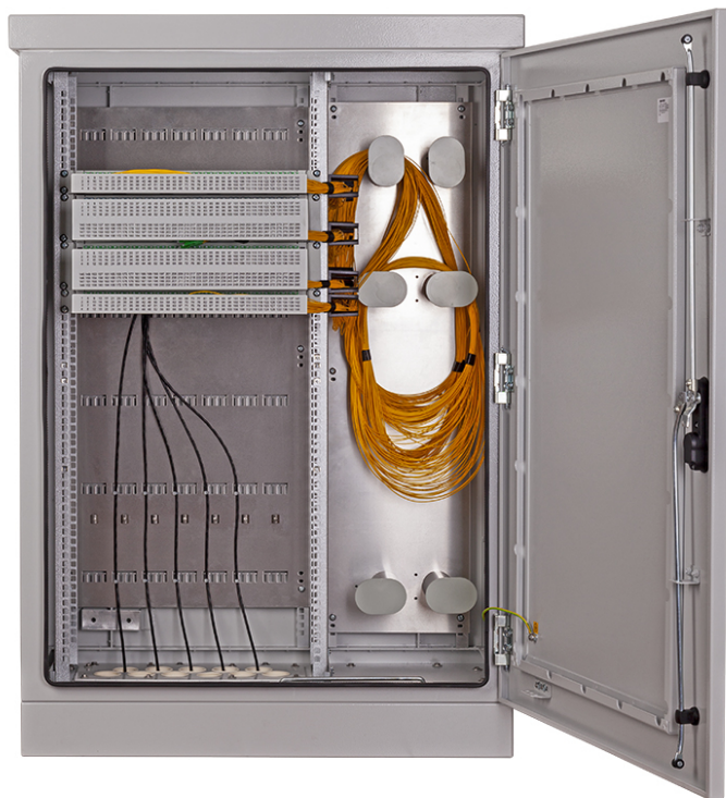
Stojanový datový rozvaděč FDHM 19" 24U