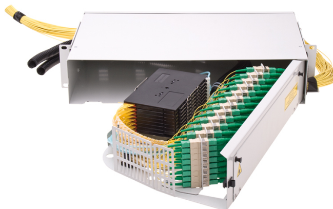
Optické vany ORMPV