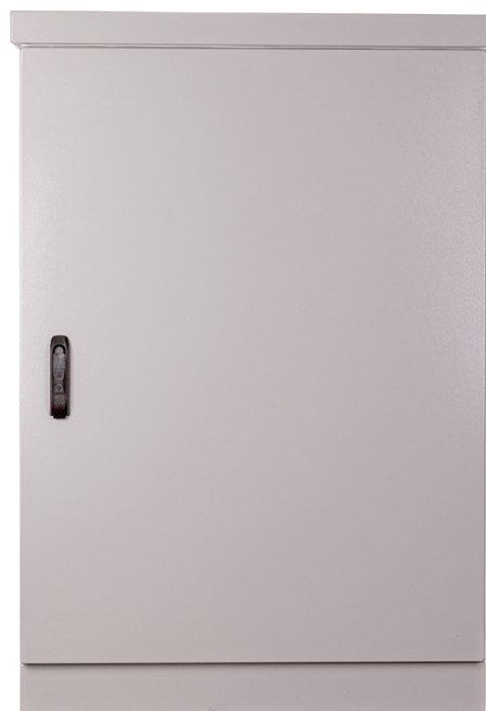
Stojanový datový rozvaděč FDHM 19" 24U