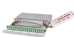
Výsuvná optická vana UHD ORMP 1U 144LC (odklopené kazety)